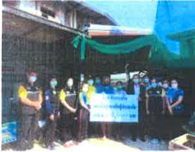
มอบเงินช่วยเหลือผู้ประสบอัคคีภัย