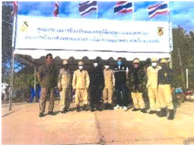
โครงการป้องกันและลดอุบัติเหตุทางถนน