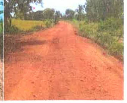
โครงการปรับปรุงถนนลูกรัง หมู่ 4