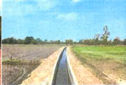
โครงการปรับปรุงคูส่งน้ำ หมู่ 2