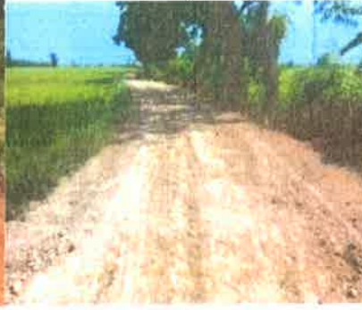
โครงการปรับปรุงถนนลูกรัง หมู่ที่ 3