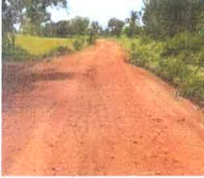
โครงการปรับปรุงถนนลูกรัง หมู่ที่ 2