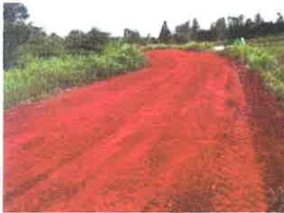
โครงการปรับปรุงถนนลูกรัง หมู่ 5