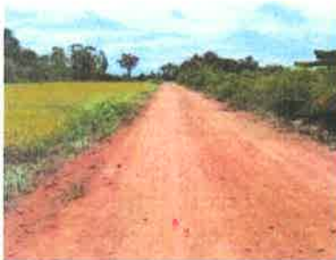
โครงการปรับปรุงถนนลูกรัง หมู่ 9