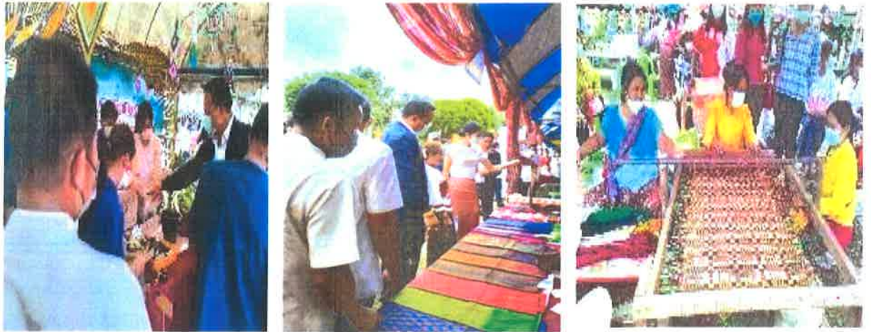
โครงการย้อมสีไหมด้วยวัสดุจากดิน(ดินมอดินแดง)